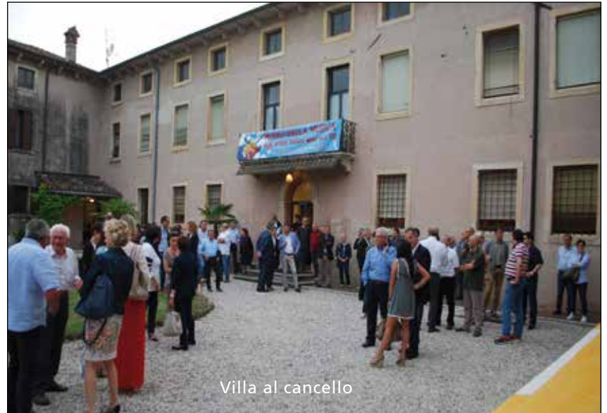
Villa al cancelli