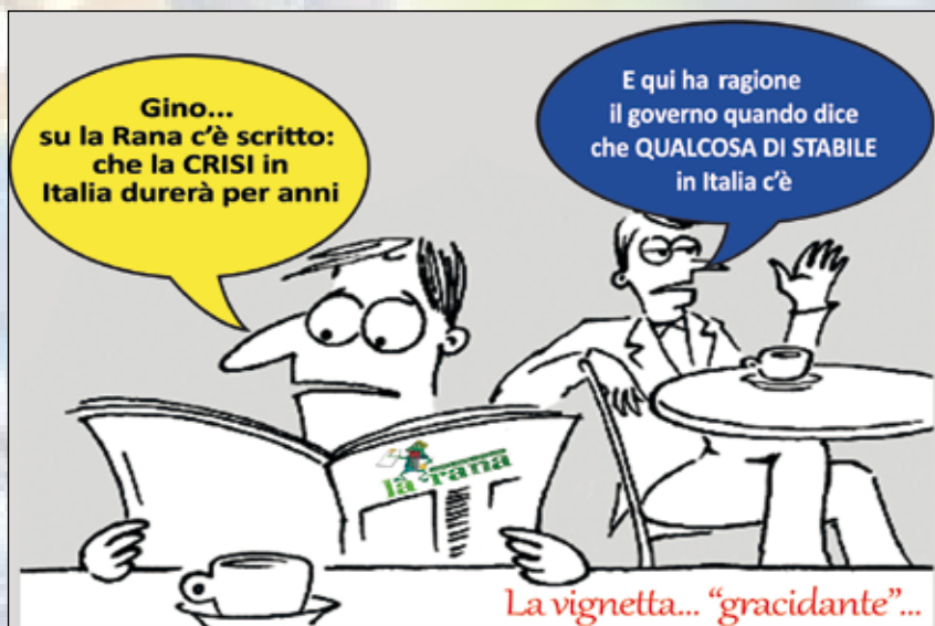
La vignetta... "gracidante"...

Dopo la consueta pausa estiva La Rana torna nelle vostre case con un numero di settembre ricco di notizie ed informazioni, usciamo un po' in anticipo rispetto al previsto per dare spazio alle tante iniziative in programma in questa prima parte d'autunno. L'estate sta giungendo ormai al termine, voi come l'avete passata? Speriamo nel migliore dei modi. Ma senz'altro questo periodo estivo non è stato dei