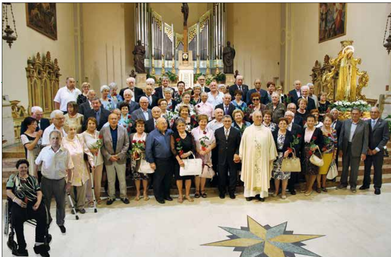
50° Anniversario di matrimonio 1967 - 2017 Chiesa Parrocchiale di Bovolone

Eseguo taglio erba pulizia giardino ed altri lavori di giardinaggio. Tel 328 2046253.