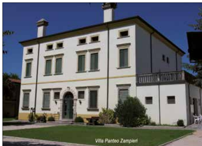
Villa Panteo Zampieri

T ra le varie proposte offerte dalla Cooperativa sociale Emmanuel in collaborazione con l'Amministrazione Comunale di Bovolone nella gestione del Centro diurno di Villa Panteo Zampieri troviamo un'attività ancora nuova che non tutti conoscono e che vogliamo approfondire in questo spazio.