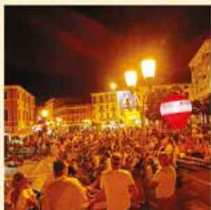
Giovedì in Piazza