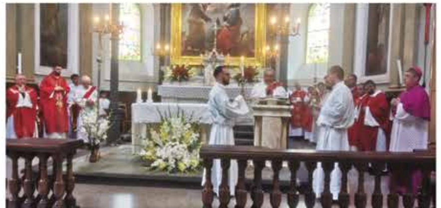
29 giugno Celebrazione S.Messa nelle chiesa di Pietro e Paolo